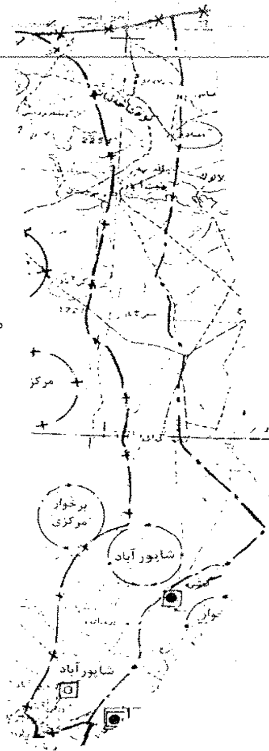
نقشه ۱:۲۵۰۰۰۰ ایجاد دهستان شاپورآباد تابع بخش برخوار شهرستان برخوار و میمه